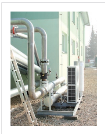
BPS, Vysoké Mýto - GTS 400