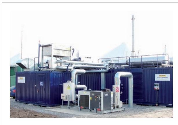
BPS, Chořkovce - GTS 800