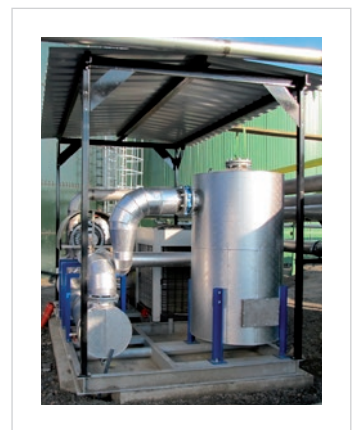
BPS, Pustějov - GTS 1200